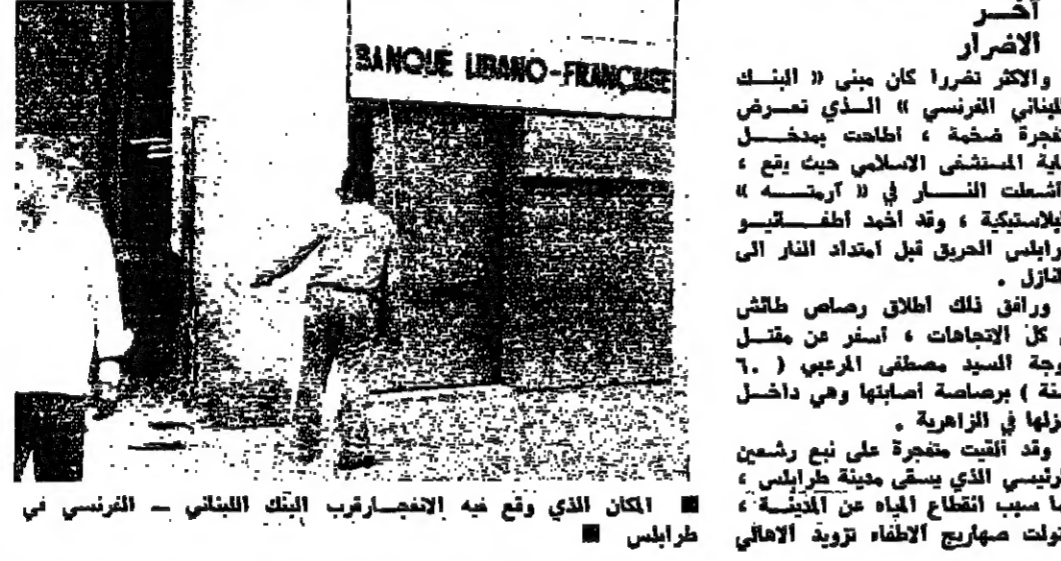
المكان الذي وقع فيه الانفجار قرب البنك اللبناني - الفرنسي في طرابلس

وقد اتصل المحافظ العماد بوزير المالية ، وبدايات ملاحق ازمة خبز في الاحياء الداخلية ، خاصة منطقة الحدادين . وتقرر